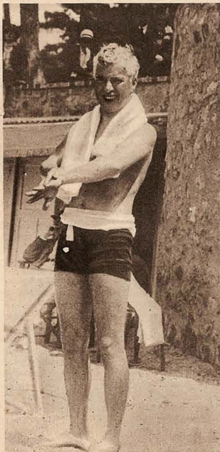
Jak widzimy Charlie Chaplin wygląda świetnie: pobyt na Riwierze dobrze mu się przysłużył!